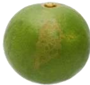
ก.6.2 ไม่เกิน 10%