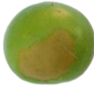
ก.3.2 มีรอยข้ำ หรือเน่าเสียที่ทำให้ ไม่เหมาะสมกับการบริโภค (ข้อ 2.1.1 (ค))