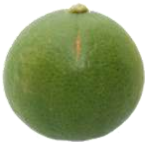
ก.6.1 ไม่เกิน 5%

ภาพที่ ก.5 ตัวอย่างลักษณะตำหนิที่ผิวของมะนาว (ข้อ 2.2.2 (ค) และ 2.2.3 (ค))