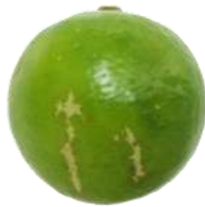
ก.5.3 ร่องรอยการเข้าทำลายของแมลง (เพลี้ยไฟ)

ภาพที่ ก.5 ตัวอย่างลักษณะตำหนิที่ผิวของมะนาว (ข้อ 2.2.2 (ค) และ 2.2.3 (ค))