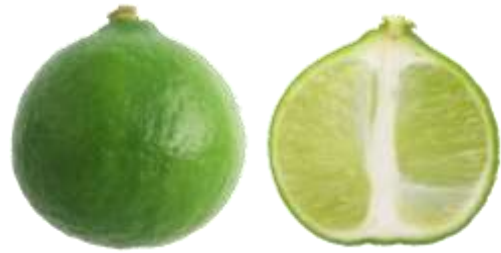
ก.1.2 มะนาวไข่