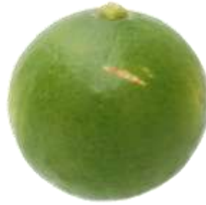
ก.5.2 รอยแผลที่สมานแล้ว