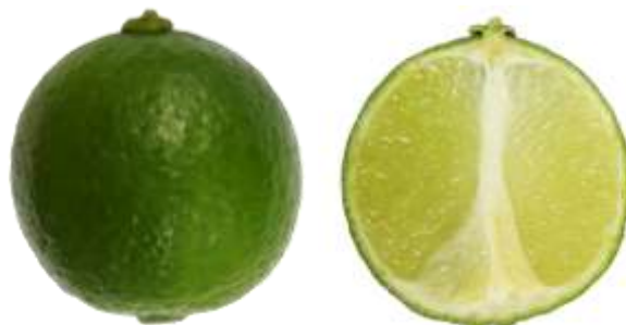
มะนาวตาฮิติ

ภาพที่ ก.1 ตัวอย่างผลมะนาว Citrus aurantiifolia (Christm.) Swingle พันธุ์ที่ผลิตเป็นการค้า (ข้อ 1.1)