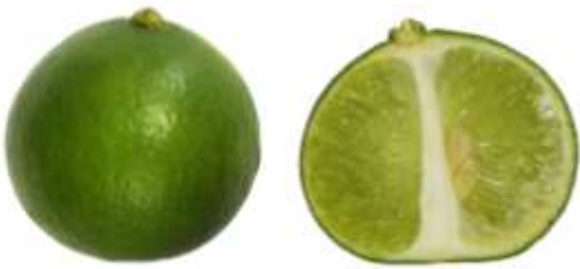
ก.1.1 มะนาวแป้น