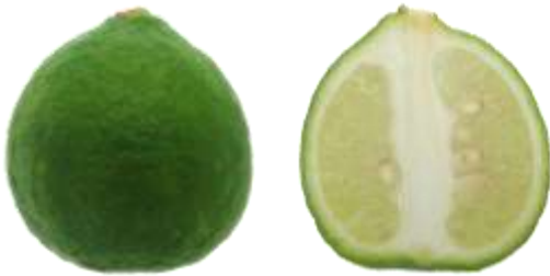
ก.1.3 มะนาวหนัง