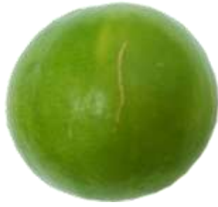
ก.5.1 รอยขีดข่วน