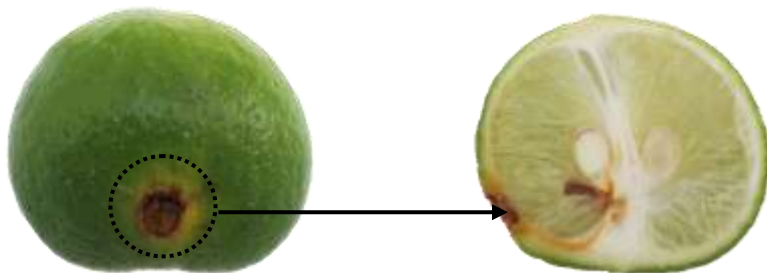
ก.3.4 มีความเสียหายเนื่องจากศัตรูพืชที่มีผลกระทบต่อคุณภาพภายในของมะนาว (ข้อ 2.1.1 (ฉ))