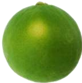
ภาพที่ ก.3 ตัวอย่างลักษณะผลมะนาวที่ไม่ผ่านข้อกำหนดขั้นต่ำ (ข้อ 2.1.1)