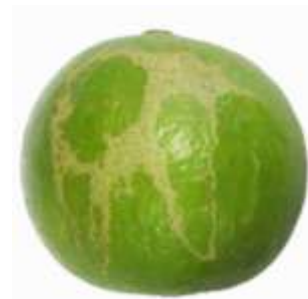
ก.6.3 มากกว่า 10%

ภาพที่ ก.6 ตัวอย่างขนาดของตำหนิที่ผิวโดยรวม (ข้อ 2.2.2 (ค) และ 2.2.3 (ค))