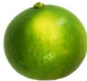
ภาพที่ ก.4 ตัวอย่างลักษณะสีผิวของมะนาวที่มีแต้มสีเหลือง (yellow patches) รวมกันไม่เกิน 30% ของพื้นที่ผิวทั้งหมดของผล (ข้อ 2.1.4)