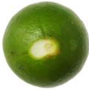
ก.3.1 บริเวณขั้วผลที่ถูกปลิดออก ฉีกขาด (ข้อ 2.1.1 (ก))