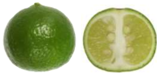
ก.1.4 ลูกผสมพิจิตร 1

ภาพที่ ก.1 ตัวอย่างผลมะนาว Citrus aurantiifolia (Christm.) Swingle พันธุ์ที่ผลิตเป็นการค้า (ข้อ 1.1)